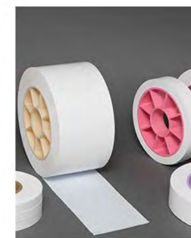
リチウムイオン 2次電池の セパレーター