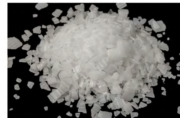
工業界で用いられる苛性ソーダ