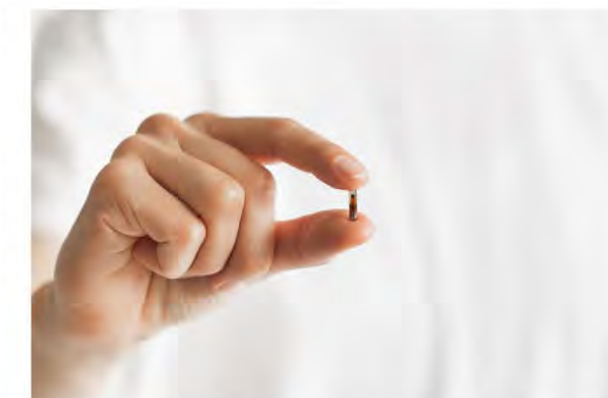
スマートフォン等に内蔵される 電子コンパス