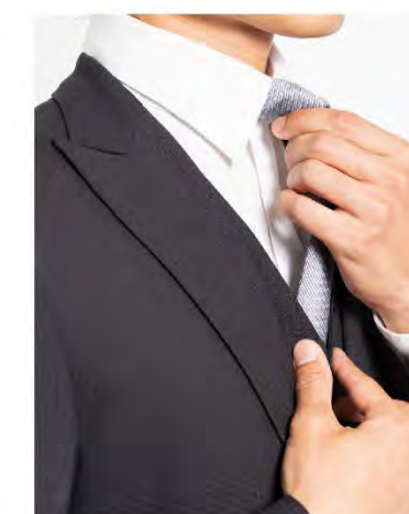
ベンベルグや キュプラ等の 衣料用化学繊維