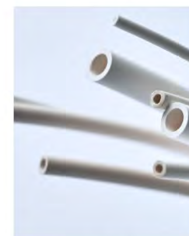
中空糸と、 それから作られる ウイルス除去透過膜 や人工透析膜